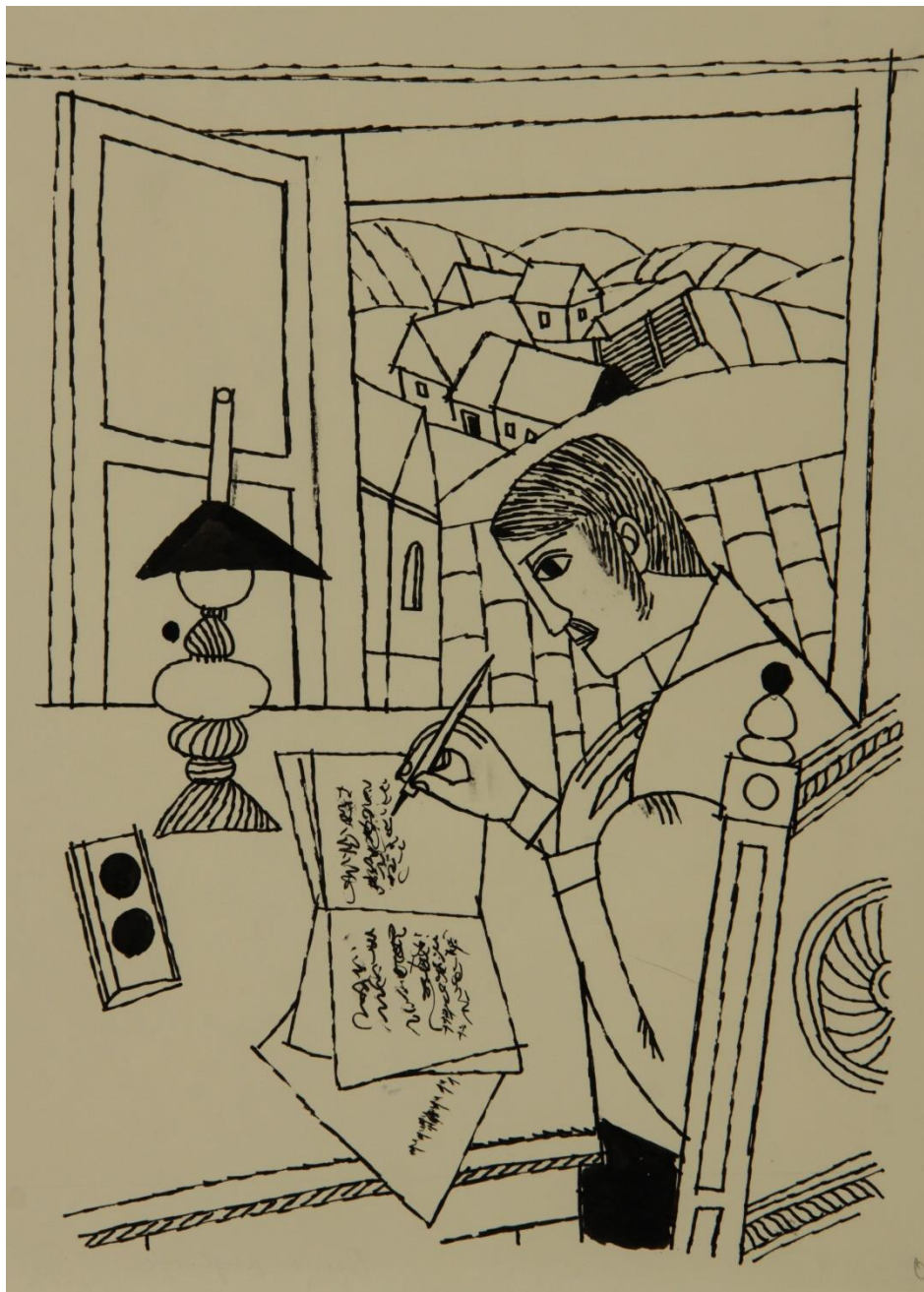
Milan Bizovičar, ilustracija knjige Deseti brat, 1966-67, tuš na papirju

KAKO PA JE BILO V ČASU PRED RAČUNALNIKI IN TELEFONI? OGLEJ SI RISBO MOŠKEGA PRI PISANJU. NA MIZI IMA PETROLEJKO, TOREJ SE ILUSTRIRANA ZGODBA DOGAJA ŠE PRED IZUMOM ELEKTRIKE. S ČIM PIŠE? KAJ POTREBUJE PRI PISANJU? ČE PIŠE PISMO, KAKO GA BO ODPOSALAL? KAKO DOLGO BO PISMO POTOVALO ČEZ VSE TE HRIBE, KI SE RAZPROSTIRAJO SKOZI OKNO?